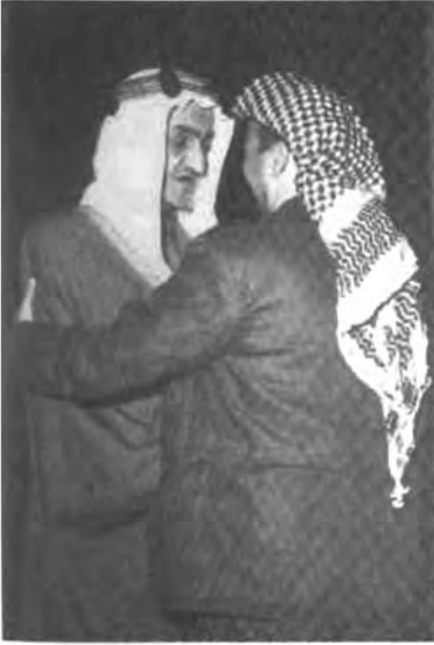
مع الملك فيصل بن عبد العزيز آل سعود